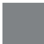
RAL 9007 Graualuminium matt oder Feinstruktur