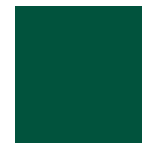
RAL 6005 Mossgrün matt oder Feinstruktur