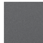
DB 703 Metallic matt oder Feinstruktur