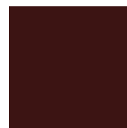
RAL 8017 Schokoladenbraun matt oder Feinstruktur