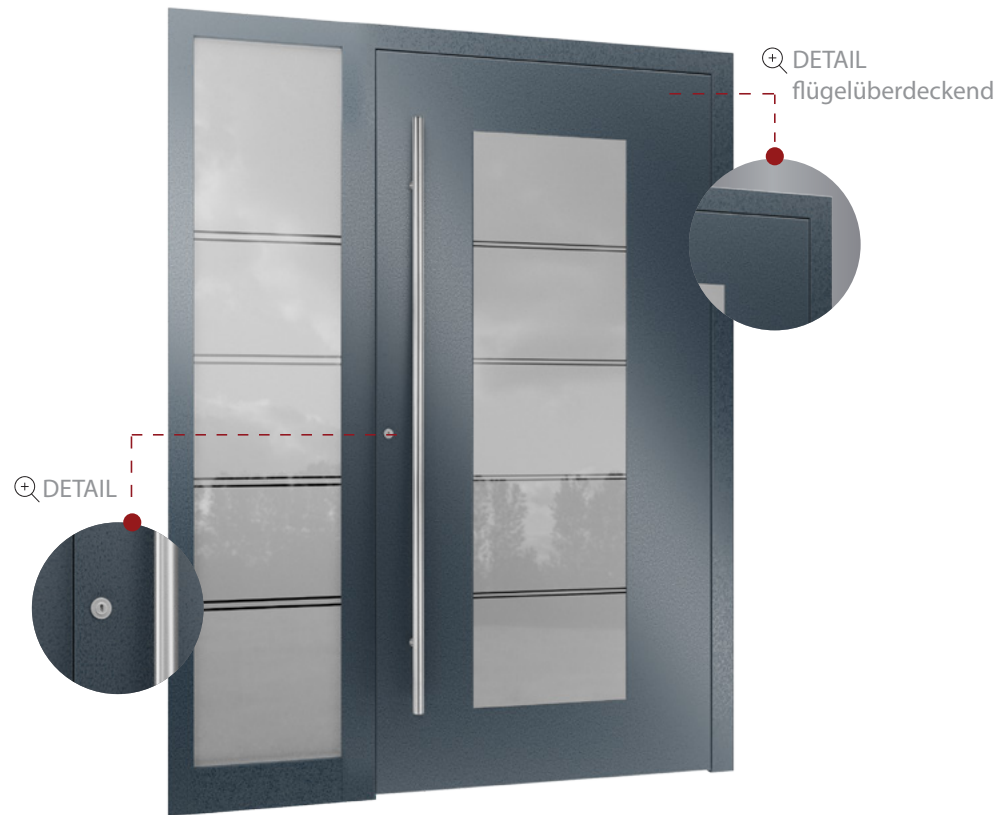
Haustür RKA 1 mit Seitenteil „Anwendungsbeispiel“