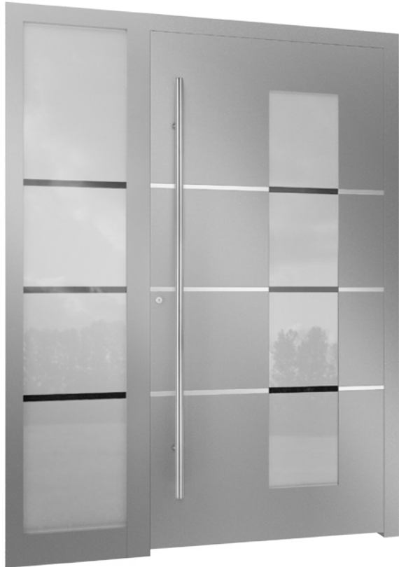
Haustür RKA 4 mit Seitenteil „Anwendungsbeispiel“