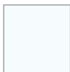
RAL 9016 Verkehrsweiß seidenglanz, matt oder Feinstruktur